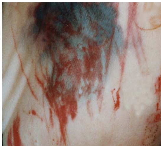
Foto 12: Bluterguss